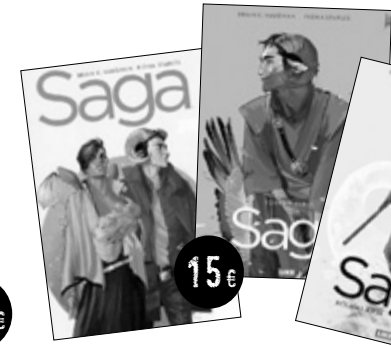
Brian K. Vaughan SAGA 1-3