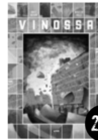
Nærum & Volle VINOSSA

LIKEN UPEAT SARJAKUVAT ERITTÄIN ASIALLISTEN HINNOIN!