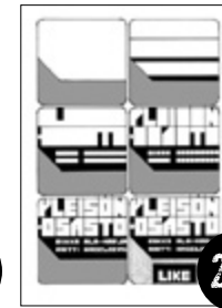
Ala-Harja & Hagelberg YLEISÖNOSASTO